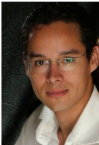
Fotógrafo Adriano Moreira | Domingo, 26 de Julho de 2012 | Foto Oficial do Angel's Brunch 2012