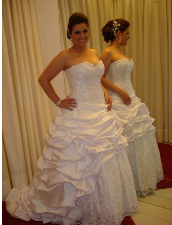
Última atualização (Sáb, 07 de Abril de 2012 08:41)