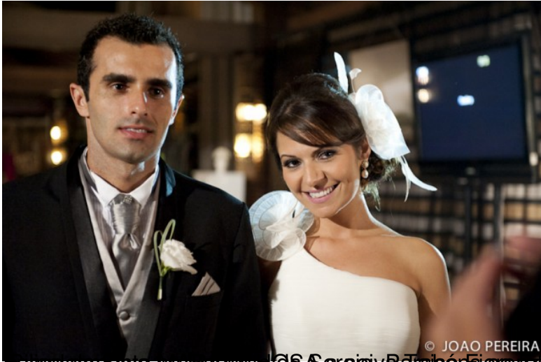
© JOAO PEREIRA A noiva do mês de Novembro é a bela Rodrigo