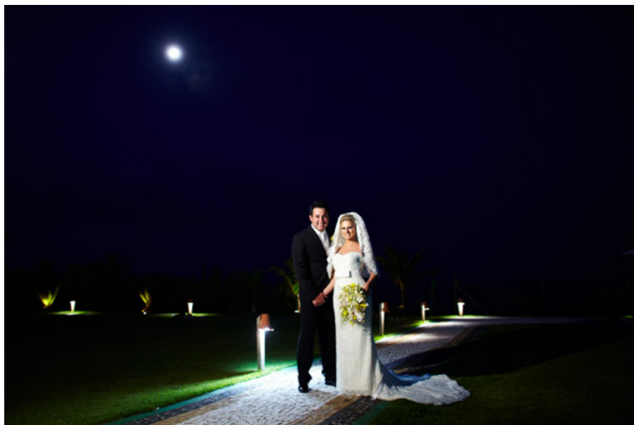
Maquiagem.: Saionara Duarte